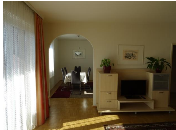
Blick vom Wohnraum ins Esszimmer