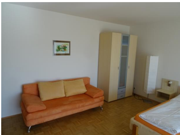
Schlafsofa im Wohn/Schlafzimmer